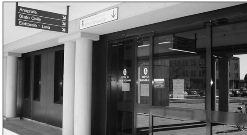
L'ingresso degli Uffici demografici del Comune di Montichiari.