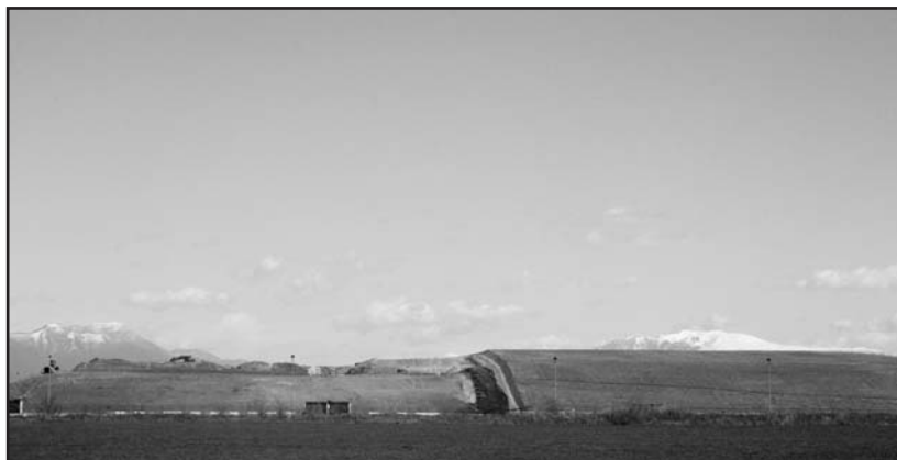
Il "caratteristico" profilo delle discariche nella campagna di Montichiari.

La Giunta Municipale ha deliberato un contributo di 70.000 euro all'Associazione "Teatro Sociale di Montichiari" per la programmazione degli spettacoli teatrali previsti da gennaio ad aprile 2008. La spesa complessiva per la stagione teatrale settembre 2007-aprile 2008 ammonta a circa 220.000 euro.