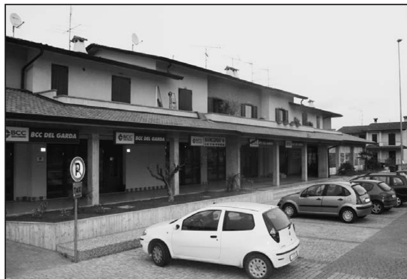
La nuova accogliente sede della BCC del Garda ai Novagli.