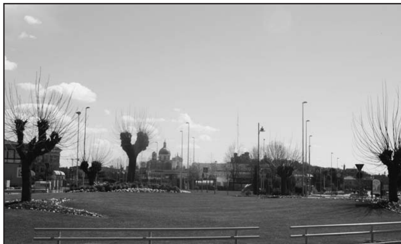
Il gradevole ingresso in Montichiari alla "rotonda dei gelsi" presso il ponte del Chiese.

Il paragone però è con gli altri paesi della provincia come Desenzano, terzo in graduatoria con 53.551.738, a seguire Ponte di Legno con 37.061.214. Lu-mezzane è attestato a