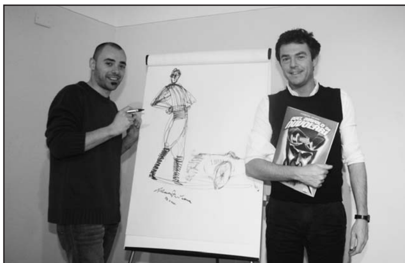
Gli autori del libro durante la presentazione.

Al GALETÉR continuano le iniziative culturali con una intensa programmazione mensile che premia lo sforzo della gestione inedita ed avvincente di un piacevole luogo di incontro.